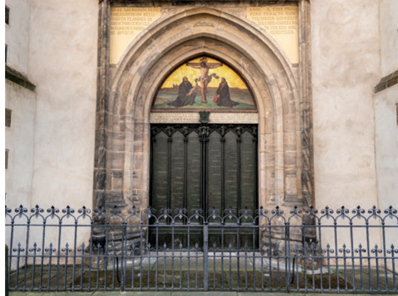
Reformationstür an der Wittenberger Schlosskirche